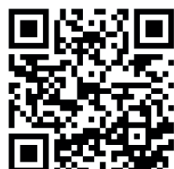
La fiche produit CLIMAFORCE 5 BP1 1V EI30