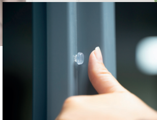
Remplacement d'une butée sur huisserie à recouvrement