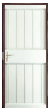
Porte, côté verso