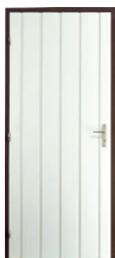
Porte, côté recto