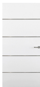
Matricée et Gravée